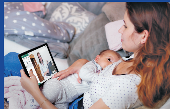
Für Eltern ist die TeleHebamme während der dreijährigen Pilotphase kostenlos

Interessierte können sich unter 06761 / 81-1321 oder telehebamme@ kreuznacherdiakonie.de melden.