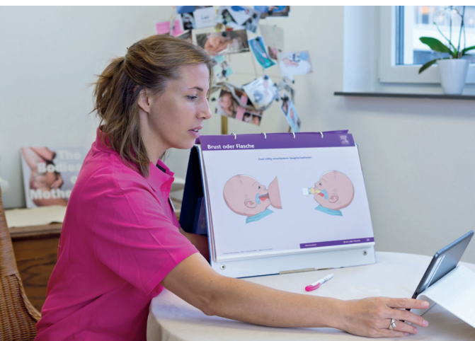
Examinierte Hebammen betreuen Sie persönlich in der Videosprechstunde

Die wissenschaftliche Begleitung des dreijährigen Projekts übernimmt die Universität Koblenz-Landau. Zur Entwicklung des ländlichen Raums wird die TeleHebamme durch Mittel der Europäischen Union und des Landes Rheinland-Pfalz gefördert.