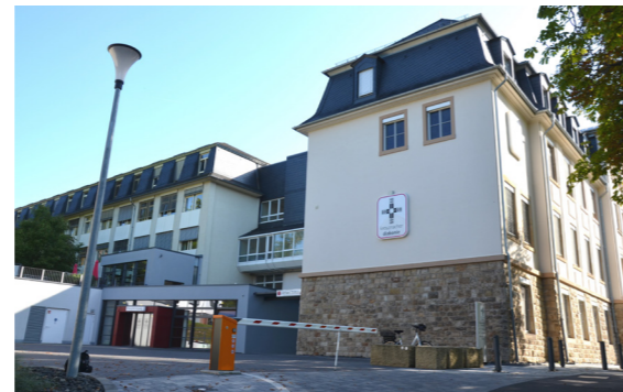
Diakonie Krankenhaus Kirn