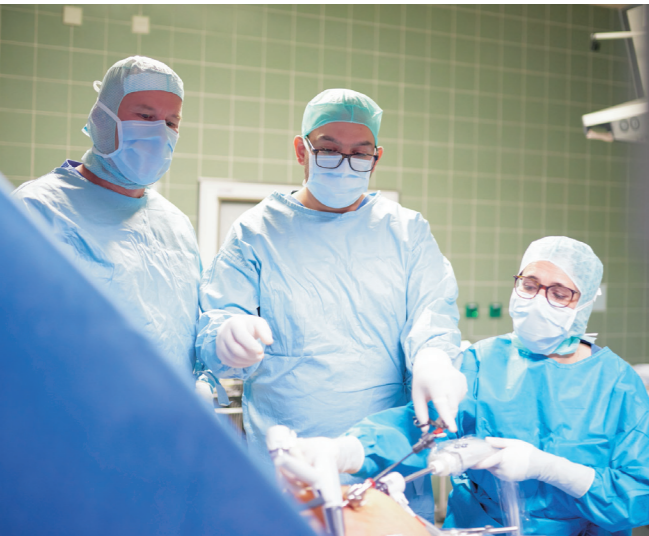
Gefäße können mit einem Stent geschient werden

Aus dem Leitbild der Stiftung kreuznacher diakonie