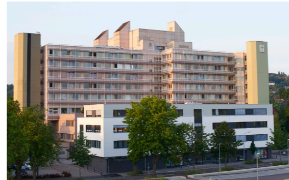
Diakonie Krankenhaus Bad Kreuznach