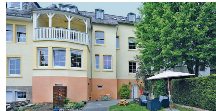
Eltern-Kind-Gruppe 2 in der Amalienstraße 4 in Kirn

Das Hilfsangebot versteht sich als eine komplexe, multifunktionale Leistung. Angebote der stationären Hilfe zur Erziehung bzw. der Hilfe für junge Volljährige werden entsprechend der unterschiedlichen pädagogischen Aufgabenstellung erweitert. Mit Blick auf die Anforderungen hinsichtlich der besonderen Verhaltens- und Lernstrukturen von Müttern oder Vätern mit psychischen Beeinträchtigungen, Lernbehinderung oder leichtgradiger geistiger Behinderung werden die Hilfen flexibel dem individuellen Bedarf angepasst. ■