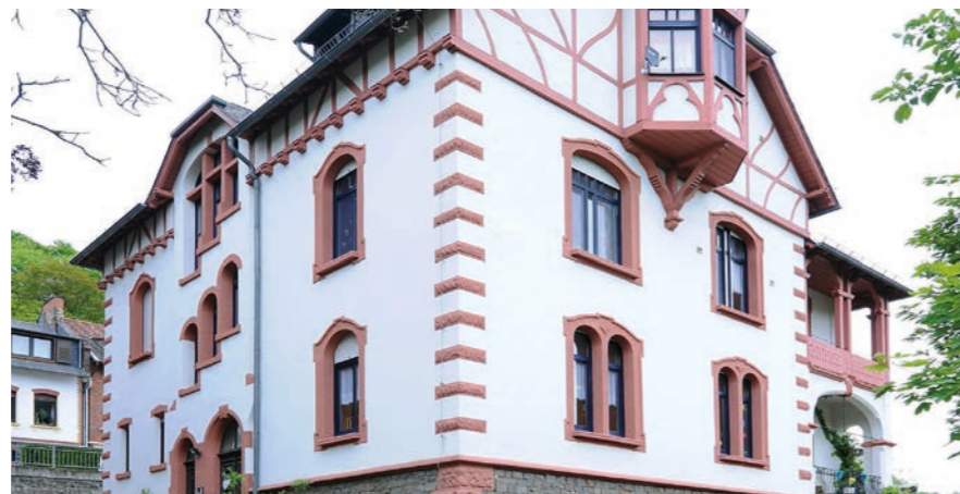
Eltern-Kind-Gruppe 1 im Halmer Weg 10 in Kirn

Das Team arbeitet nach einem ganzheitlichen und ressourcenorientierten Ansatz. Es wird darauf geachtet, die Biographien der Frauen zu erfahren, um bestehende Verhaltensmuster verstehen zu können. Zudem wird geschaut, welche Fähigkeiten jede Frau mitbringt. Ressourcenorientiert werden diese Fähigkeiten genutzt, um alltägliche Kompetenzen im Umgang mit den Kindern, aber auch mit sich selbst, zu erlernen. ■