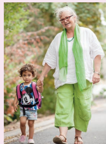
Immer im Fokus: das Wohl des Kindes