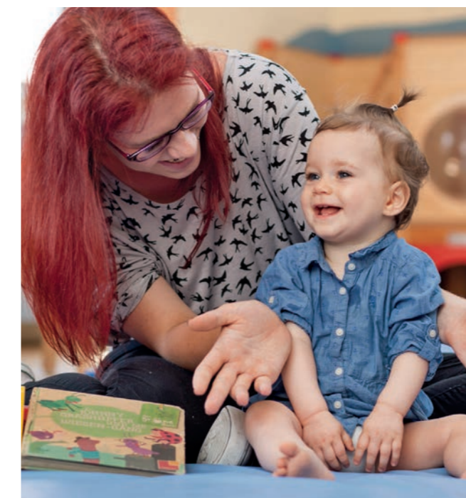
Spielerisches Lernen beim Morgenkreis in der Gruppe

Aus dem Leitbild der Stiftung kreuznacher diakonie