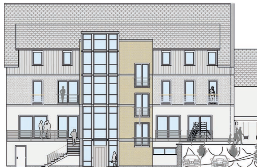
Rückansicht der neuen Eltern-Kind-Gruppe in Rhaunen

Die neue Eltern-Kind-Gruppe entsteht in der Ortsgemeinde Rhaunen am Rande des Hunsrücks. Großzügige Apartments bieten (schwangeren) Müttern oder (werdenden) Vätern die Gelegenheit sich zurückzuziehen. Als besonderes Angebot stellt die Gruppe in Rhaunen auch Plätze für Mütter oder Väter mit geistiger oder körperlicher Behinderung zur Verfügung. Speziell geschulte Mitarbeitende kümmern sich um die Anleitung und Unterstützung der jungen Eltern. ■